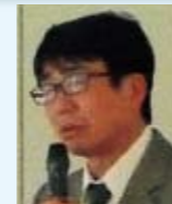
東京慈恵医科大学 水之江義充 教授